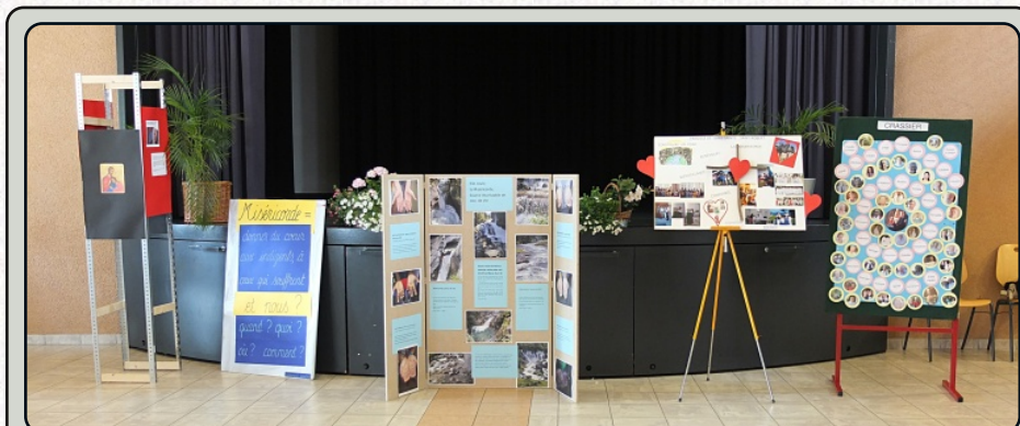
Les panneaux des communautés. De gauche à droite: St-Cergue, La Colomnière, Gland, St-Robert, Crassier.