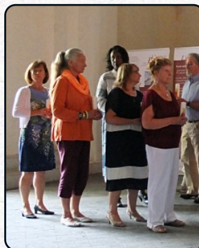
Les porteurs de bougies